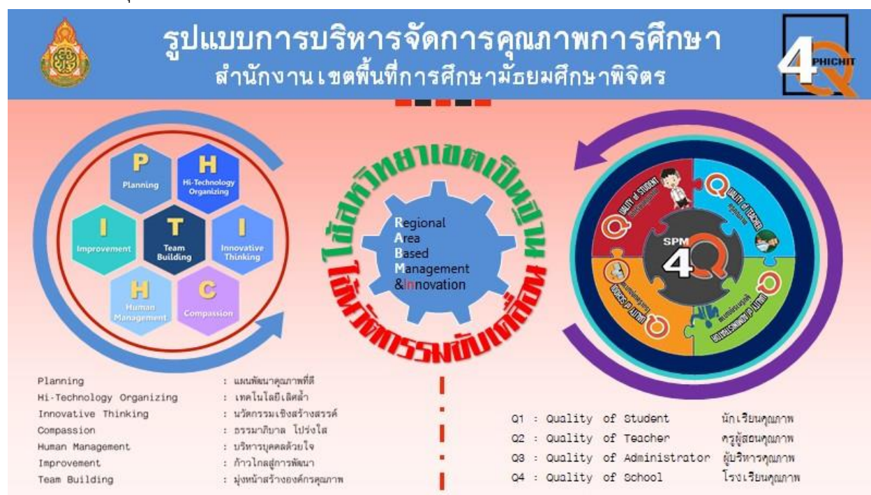
ภาพที่ 1 รูปแบบการบริหารจัดการองค์กรคุณภาพ

เมื่อมองถึงวิถีและมิติความสัมพันธ์ในการปฏิบัติงาน การนิเทศเชิงระบบเป็นการนิเทศที่อาศัยความเชื่อมโยงสัมพันธ์ระหว่างผู้นิเทศ (ศึกษานิเทศก์) กับหน่วยงาน องค์กร บุคลากร ตลอดจนปัจจัยอื่นที่มากกว่าหนึ่งมิติ มีการปฏิบัติงานทั้งโดยทีมสัมพันธ์ และรายบุคคล ประการสำคัญต้องมีความรับผิดชอบในภารกิจ การปฏิบัติงาน มุ่งเน้นสัมฤทธิ์ผลของหน่วยงานเป็นสำคัญซึ่งแสดงมิติความสัมพันธ์ในการปฏิบัติงาน โดยมีแนวทางการพัฒนาคุณภาพการศึกษาดังภาพ