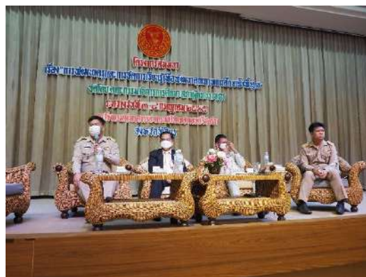
18. สำนักงานเขตพื้นที่การศึกษามัธยมศึกษาพิจิตร ได้วางแผน แลกเปลี่ยนความรู้ ความคิดเห็น และ ร่วมประชุมโครงการทุนการศึกษาพระราชทานสมเด็จพระบรมโอรสาธิราชฯ สยามมกุฎราชกุมาร ( ม.ท.ศ. ) รุ่นที่ 14 ปีการศึกษา 2565